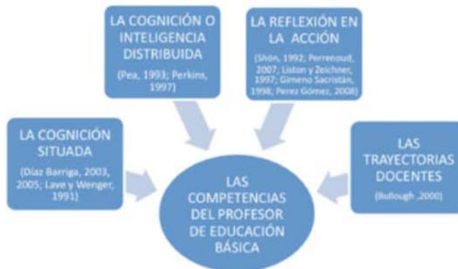
Figura 1. Principales aproximaciones teóricas del ámbito psicopedagógico que dan sustento al modelo

aprendizaje, el pensamiento y el conocimiento son relaciones entre las personas en actividad, y se generan a partir de un mundo estructurado social y culturalmente" (Lave y Wenger, 1991, p. 24).