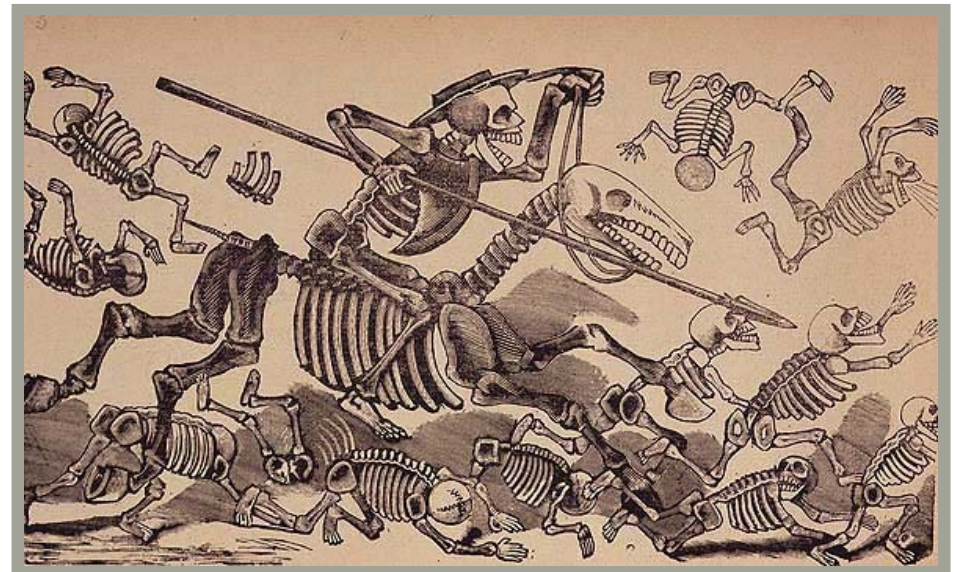
Calavera «Don Quijote y Sancho Panza»