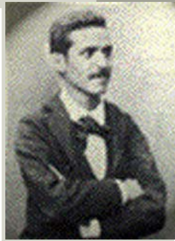
JOSÉ GUADALUPE POSADA

En 1887 se fue a vivir a la ciudad de México; instaló su primer taller en la calle de Santa Teresa y después se cambió a la calle de Santa Inés número 5, hoy calle de Moneda. Muy pronto comenzó a trabajar como dibujante editorial en el taller de Antonio Vanegas Arroyo, para quien realizó miles de ilustraciones. Realizó ilustraciones y caricatura política en otras imprentas y algunos periódicos, como el «Argos», «La Patria», «El Ahuizote» y «El Hijo dei Ahuizote», todos de oposición al gobierno del presidente Porfirio Díaz.